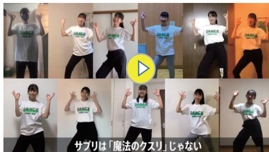
東京都立狛江高等学校ダンス部の皆さんによるパフォーマンス動画